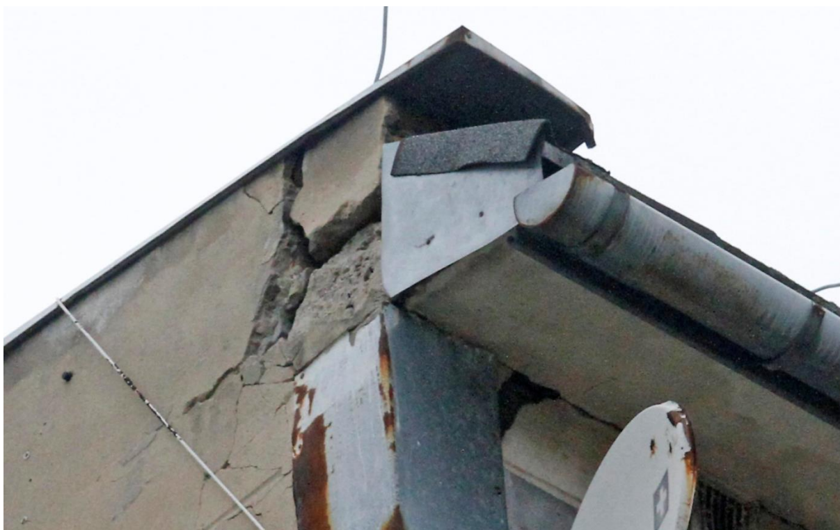
Fot. 2A. Chetmek ul. Żeromskiego 1 – budynek mieszkalny wielorodzinny fragment elewacji południowej. Zbliżenie na szczeliny będące potencjalnymi miejscami lęgowymi jerzyków Apus apus oznaczone na fot. 2.