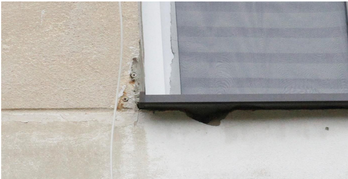
Fot. 3B. Chetmek ul. Żeromskiego 1 – budynek mieszkalny wielorodzinny fragment elewacji wschodniej. Zbliżenie na szczelinę pod parapetem okiennym będącą potencjalnym miejscem lęgowym jerzyków Apus apus oznaczone na fot. 3.