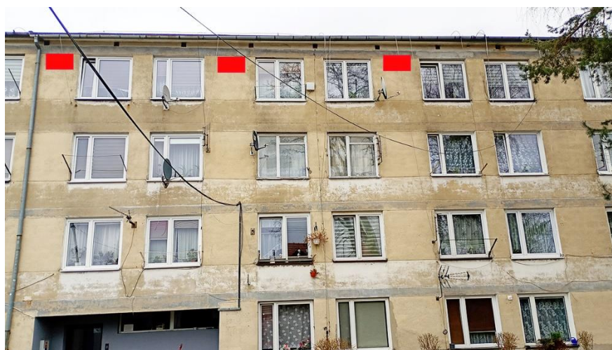
Fot. 11. Chętnek ul. Żeromskiego 1 – budynek mieszkalny wielorodzinny część elewacji zachodniej. Zalecane miejsca montażu 3 podwójnych budek łęgowych dla jerzyków wykonanych z desek drewnianych w ramach kompensaty przyrodniczej