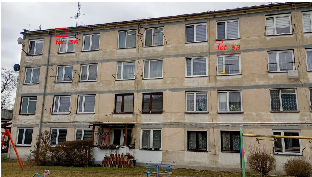
Fot. 3. Chetmek ul. Żeromskiego 1 – budynek mieszkalny wielorodzinny część elewacji wschodniej. Oznaczono szczeliny będące potencjalnymi miejscami lęgowymi jerzyków Apus apus .