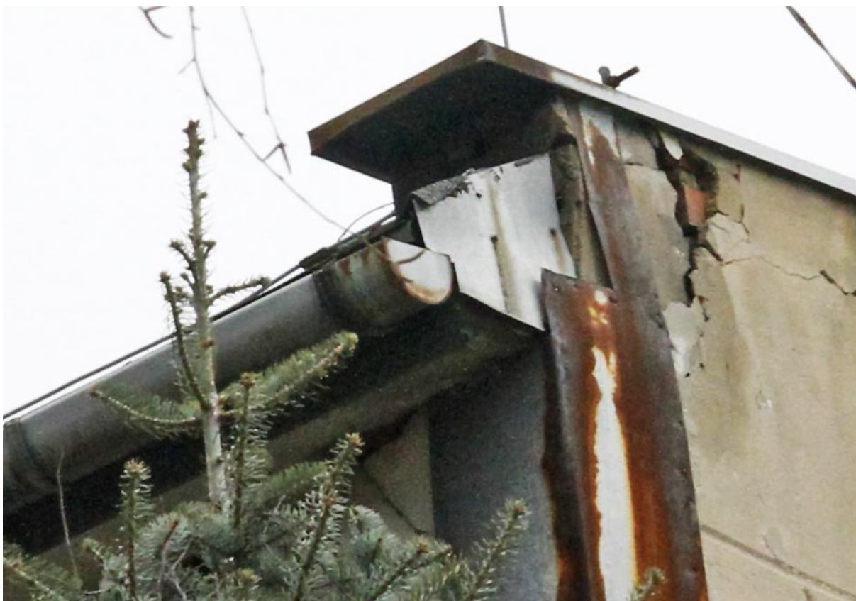
Fot. 2B. Chetmek ul. Żeromskiego 1 – budynek mieszkalny wielorodzinny fragment elewacji południowej. Zbliżenie na szczeliny będące potencjalnymi miejscami lęgowymi jerzyków Apus apus oznaczone na fot. 2.