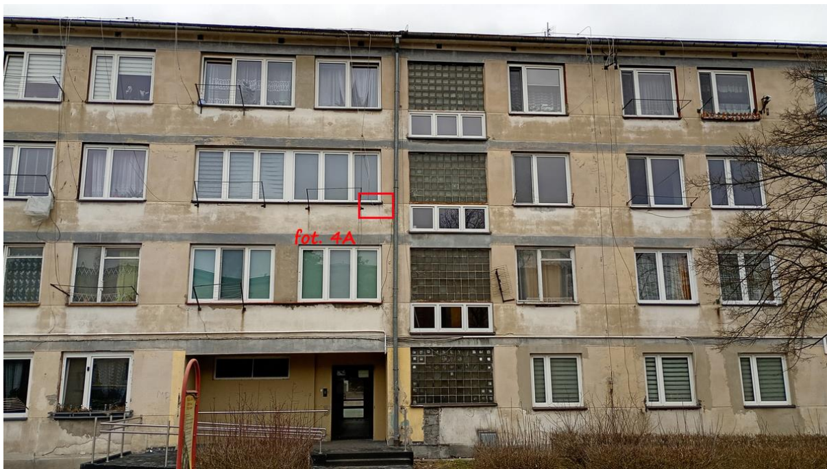
Fot. 4. Chetmek ul. Żeromskiego 1 – budynek mieszkalny wielorodzinny część elewacji wschodniej. Oznaczono szczeliny będące potencjalnymi miejscami lęgowymi jerzyków Apus apus .