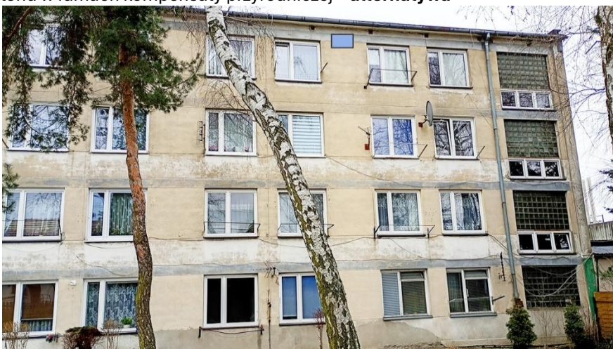
Fot. 14. Chętnek ul. Żeromskiego 1 – budynek mieszkalny wielorodzinny część elewacji zachodniej. Zalecane miejsca montażu 1 pojedynczej budki lęgowej dla jerzyków wykonanej z desek drewnianych lub trocinobetonu w ramach kompensaty przyrodniczej – alternatywa