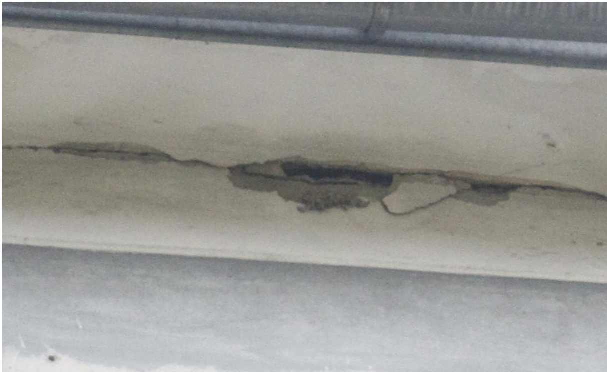
Fot. 3A. Chetmek ul. Żeromskiego 1 – budynek mieszkalny wielorodzinny fragment elewacji wschodniej. Zbliżenie na szczeliny będące potencjalnymi miejscami lęgowymi jerzyków Apus apus oznaczone na fot. 3.