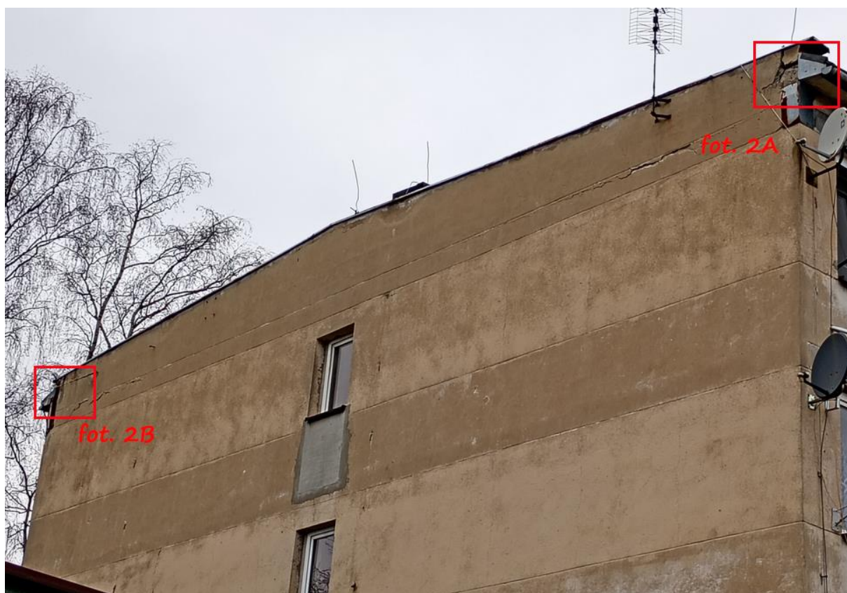
Fot. 2. Chetmek ul. Żeromskiego 1 – budynek mieszkalny wielorodzinny elewacja południowa. Oznaczono szczeliny będące potencjalnymi miejscami lęgowymi dla jerzyków Apus apus .