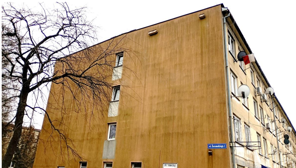
Fot. 6. Chetmek ul. Żeromskiego 1 – budynek mieszkalny wielorodzinny elewacja północna. Widoczne budki lęgowe: podwójna i pojedyncza typu „jerzyk” zamontowane przez UM w Chetmku. Nie było to związane z siedliskami tego gatunku na budynku.