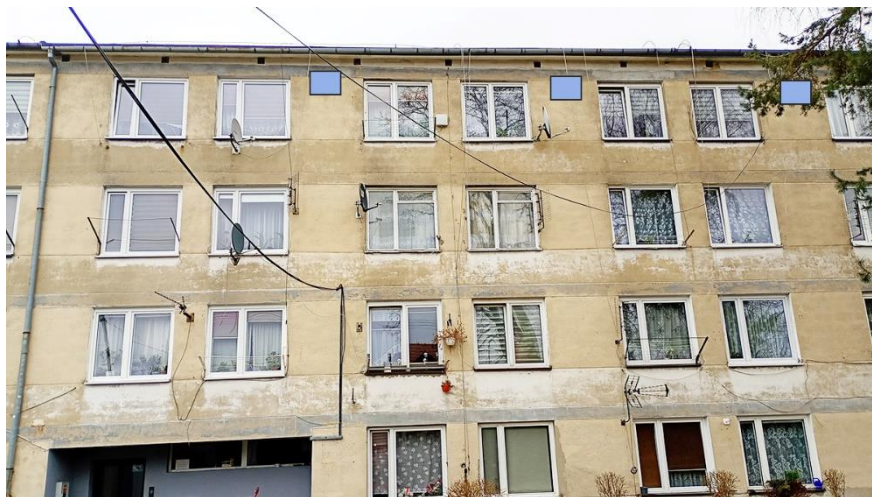
Fot. 13. Chętnek ul. Żeromskiego 1 – budynek mieszkalny wielorodzinny część elewacji zachodniej. Zalecane miejsca montażu 3 pojedynczych budek lęgowych dla jerzyków wykonanych z desek drewnianych lub trocinobetonu w ramach kompensaty przyrodniczej – alternatywa