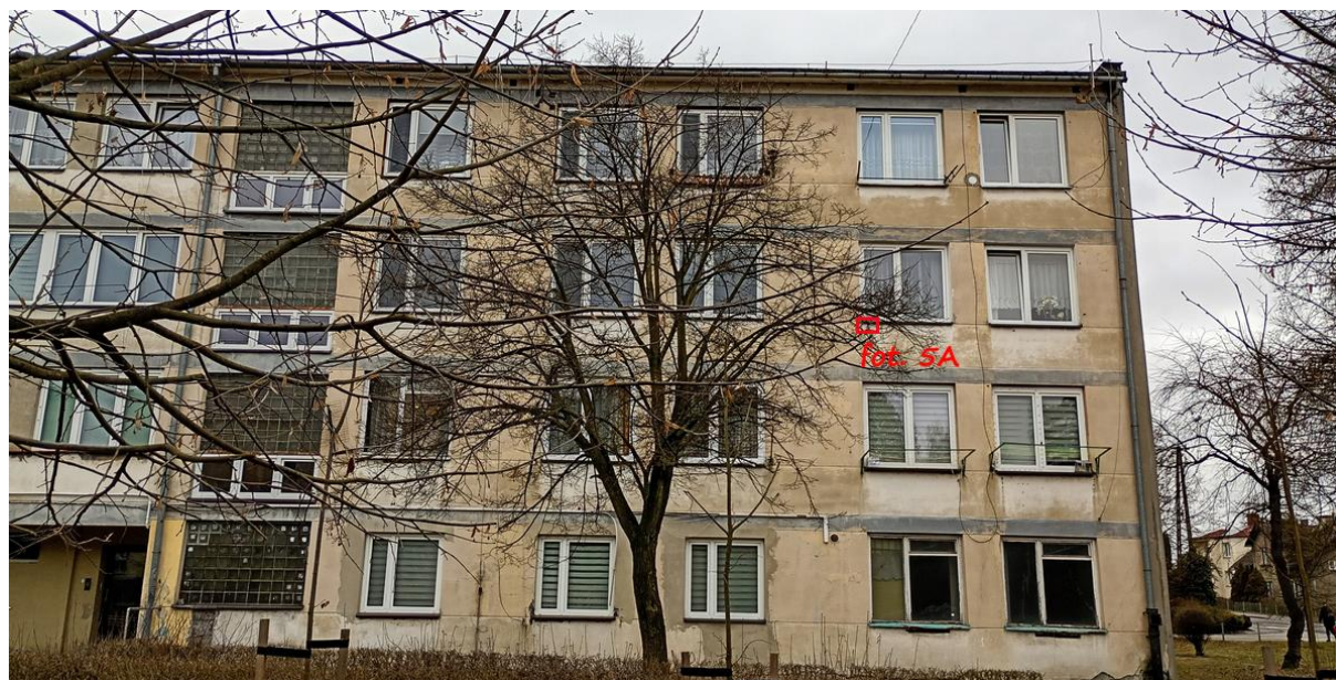
Fot. 5. Chetmek ul. Żeromskiego 1 – budynek mieszkalny wielorodzinny część elewacji wschodniej. Oznaczono szczeliny będące potencjalnymi miejscami lęgowymi jerzyków Apus apus .