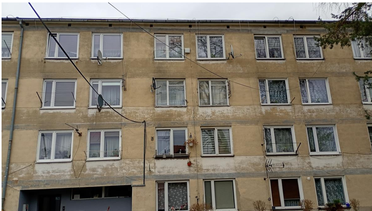
Fot. 8. Chetmek ul. Żeromskiego 1 – budynek mieszkalny wielorodzinny część elewacji zachodniej.