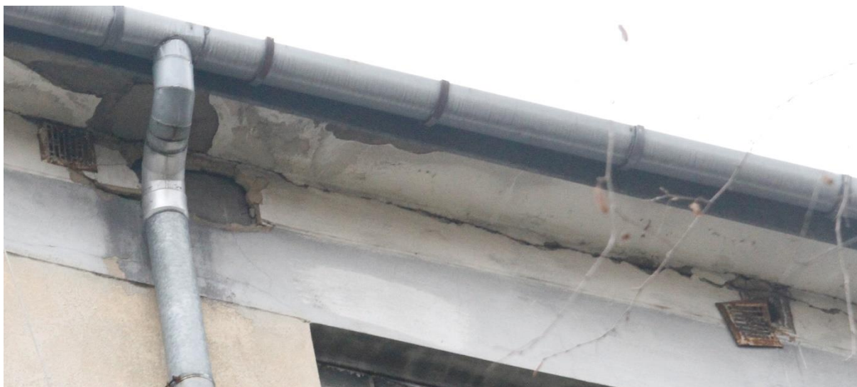
Fot. 9A. Chetmek ul. Żeromskiego 1 – budynek mieszkalny wielorodzinny fragment elewacji zachodniej. Zbliżenie na szczeliny będące potencjalnymi miejscami lęgowymi jerzyków Apus apus oznaczone na fot. 9.