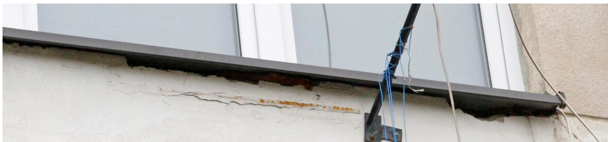
Fot. 4A. Chetmek ul. Żeromskiego 1 – budynek mieszkalny wielorodzinny fragment elewacji wschodniej. Zbliżenie na szczeliny będące potencjalnymi miejscami lęgowymi jerzyków Apus apus oznaczone na fot. 4.