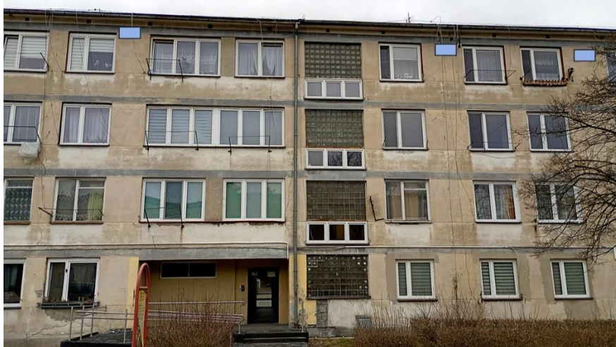
Fot. 16. Chetmek ul. Żeromskiego 1 – budynek mieszkalny wielorodzinny część elewacji wschodniej. Zalecane miejsca montażu 3 pojedynczych budek lęgowych dla jerzyków wykonanych z desek drewnianych lub trocinobetonu w ramach kompensaty przyrodniczej – alternatywa

Stanisław Czyż współpracownik terenowy Stacji Ornitologicznej MiZ PAN w Gdańsku