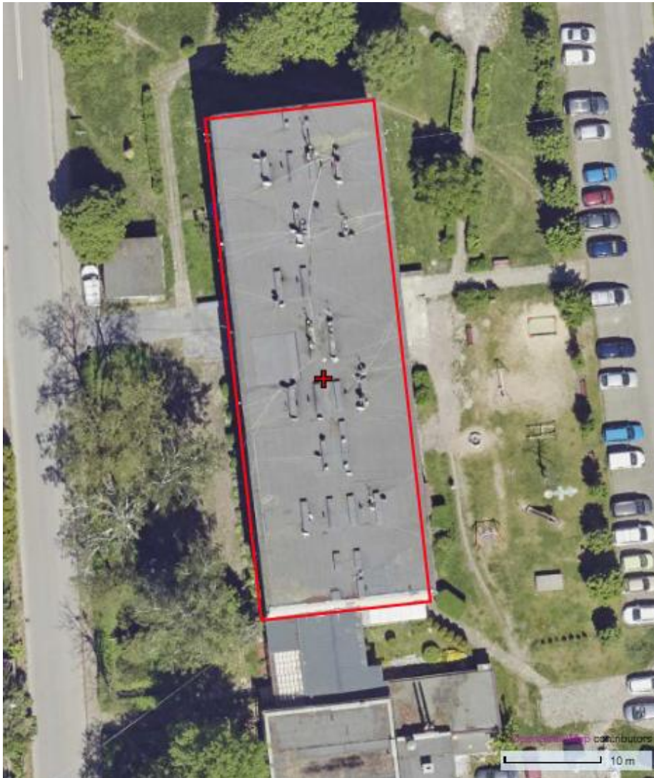
Fot. 1. Chetmek ul. Żeromskiego 1 – budynek mieszkalny wielorodzinny (widok z góry)

Budynek mieszkalny wielorodzinny zbudowany w technologii mieszanej. Posiada 4 kondygnacje, dach dwuspadowy na zewnątrz. Stropodach wentylowany, wszystkie otwory wentylacyjne przed laty zabezpieczone metalowymi kratkami. Wymiary: długość 50 m, szerokość 17 m i wysokość 11 m.