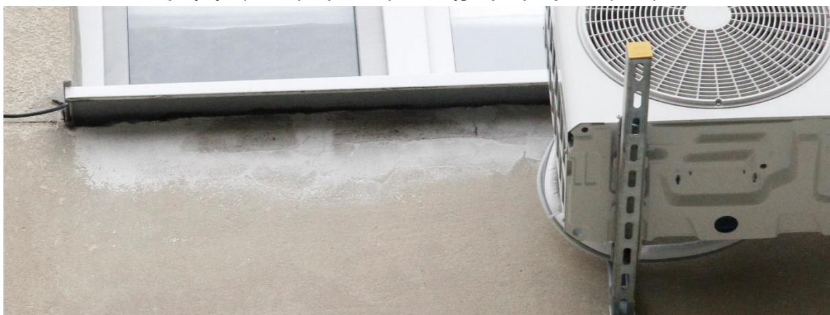
Fot. 7B. Chetmek ul. Żeromskiego 1 – budynek mieszkalny wielorodzinny fragment elewacji zachodniej. Zbliżenie na szczeliny będące potencjalnymi miejscami lęgowymi jerzyków Apus apus oznaczone na fot. 7.