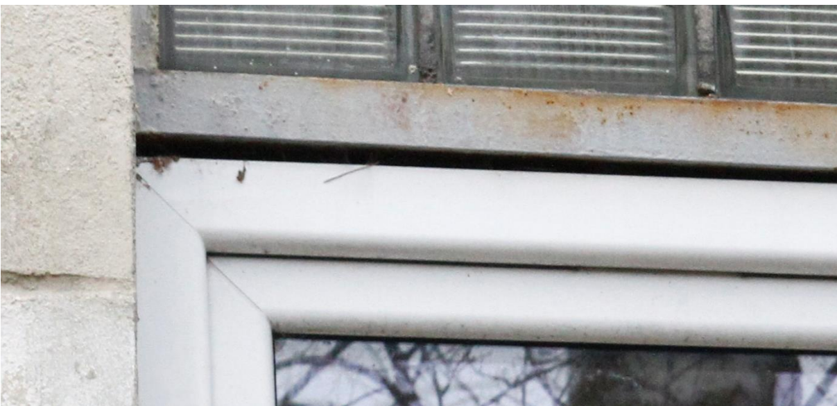
Fot. 9C. Chetmek ul. Żeromskiego 1 – budynek mieszkalny wielorodzinny fragment elewacji zachodniej. Zbliżenie na szczeliny będące potencjalnymi miejscami lęgowymi jerzyków Apus apus oznaczone na fot. 9.