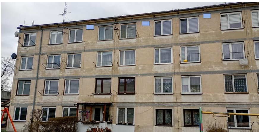
Fot. 15. Chętnek ul. Żeromskiego 1 – budynek mieszkalny wielorodzinny część elewacji wschodniej. Zalecane miejsca montażu 3 pojedynczych budek lęgowych dla jerzyków wykonanych z desek drewnianych lub trocinobetonu w ramach kompensaty przyrodniczej – alternatywa