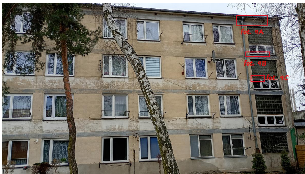
Fot. 9. Chetmek ul. Żeromskiego 1 – budynek mieszkalny wielorodzinny część elewacji zachodniej. Oznaczono szczeliny będące potencjalnymi miejscami lęgowymi jerzyków Apus apus .