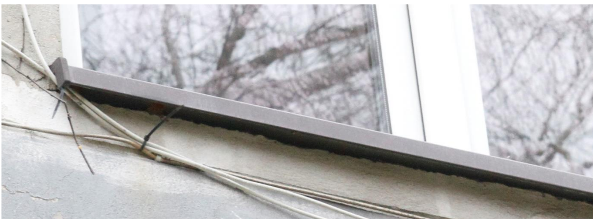
Fot. 9B. Chetmek ul. Żeromskiego 1 – budynek mieszkalny wielorodzinny fragment elewacji zachodniej. Zbliżenie na szczeliny będące potencjalnymi miejscami lęgowymi jerzyków Apus apus oznaczone na fot. 9.