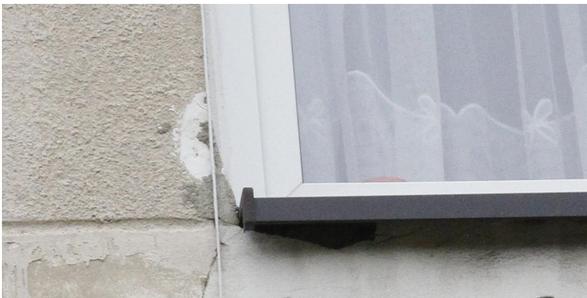
Fot. 5A. Chetmek ul. Żeromskiego 1 – budynek mieszkalny wielorodzinny fragment elewacji wschodniej. Zbliżenie na szczelinę pod parapetem okiennym będącą potencjalnym miejscem lęgowym jerzyków Apus apus oznaczone na fot. 5.