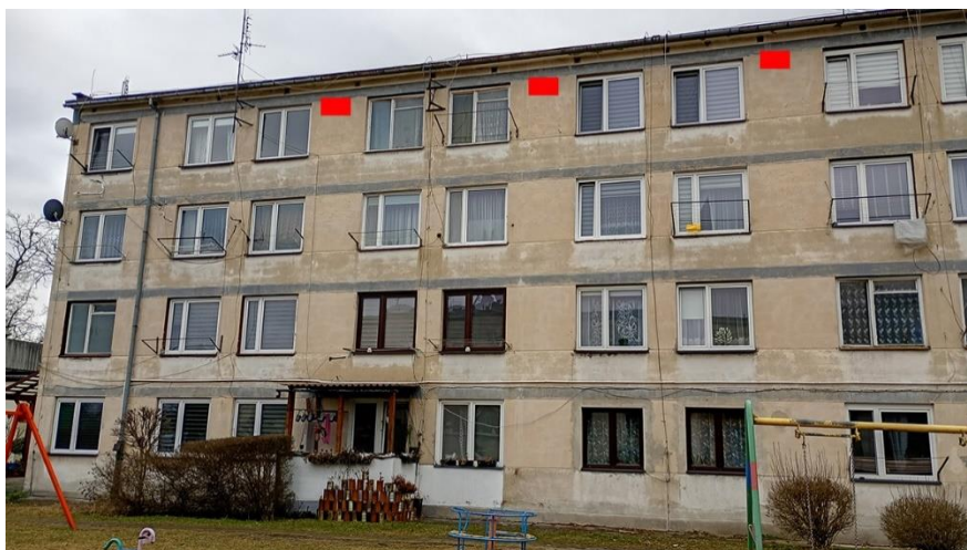
Fot. 10. Chętnek ul. Żeromskiego 1 – budynek mieszkalny wielorodzinny część elewacji wschodniej. Zalecane miejsca montażu 3 podwójnych budek łęgowych dla jerzyków wykonanych z desek drewnianych w ramach kompensaty przyrodniczej