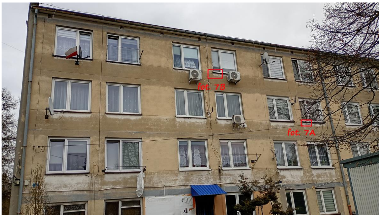
Fot. 7. Chetmek ul. Żeromskiego 1 – budynek mieszkalny wielorodzinny część elewacji zachodniej. Oznaczono szczeliny będące potencjalnymi miejscami lęgowymi jerzyków Apus apus .