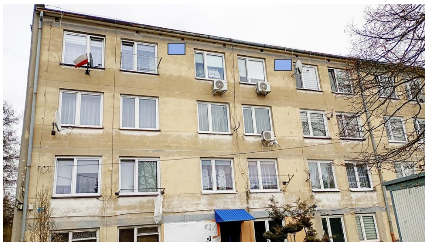
Fot. 12. Chętnek ul. Żeromskiego 1 – budynek mieszkalny wielorodzinny część elewacji zachodniej. Zalecane miejsca montażu 2 pojedynczych budek łęgowych dla jerzyków wykonanych z desek drewnianych lub trocinobetonu w ramach kompensaty przyrodniczej – alternatywa